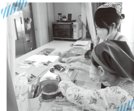
カフェで提供するおやつを準備しています