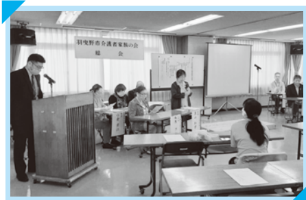
総会を開催しました