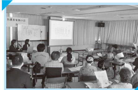
「みまもりあいアプリ」の説明をしていただきました